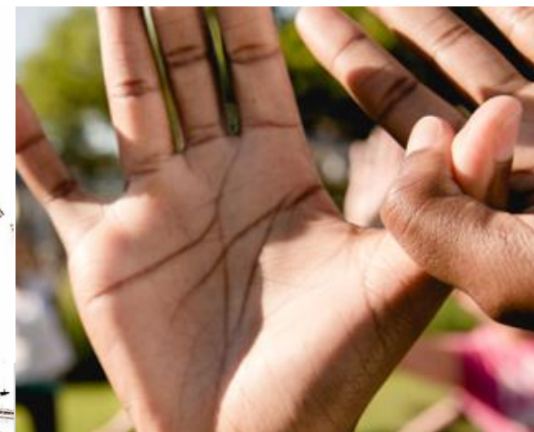
Un valore sostenibile

Ad aver introdotto più di 15 anni fa meccanismi di rimborso condizionato con Aifa.