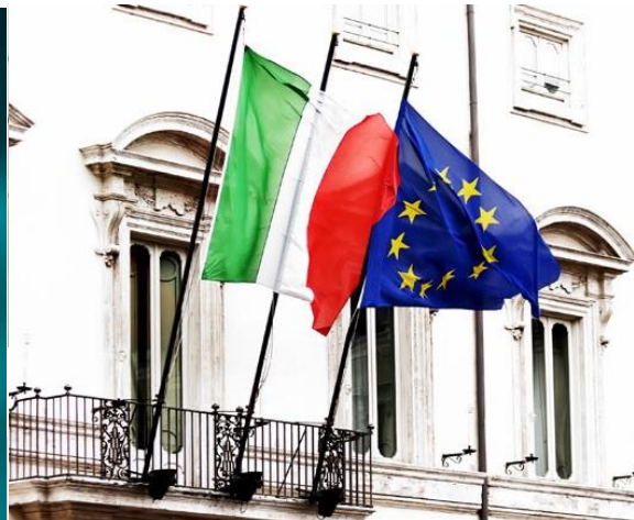
La cultura della collaborazione

Gli anni di esperienza combinata tra farmaceutica e diagnostica. Oggi l'azienda ha sviluppato un intero sistema per portare la PHC ad un nuovo livello, con l'acquisizione di FMI e Flatiron Health.